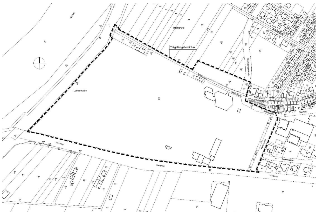
Teilbereich A der 13. Änderung des Flächennutzungsplanes im Bereich „Badesee und Wohnmobilstellplatz Altrhein“ in Lampertheim (unmaßstäblich)

Es wird darauf hingewiesen, dass Dritte (Privatpersonen) mit der Abgabe einer Stellungnahme der Verarbeitung ihrer angegebenen Daten, wie z.B. Name, Anschrift, Telefonnummer, E-Mail-Adresse etc. zustimmen. Gemäß Artikel 6 Abs. 1c und Abs. 1e der Datenschutz-Grundverordnung (DSGVO) werden die Daten im Rahmen des Bauleitplanverfahrens für die gesetzlich bestimmten Dokumentationspflichten und für die Informationspflicht den betroffenen Personen gegenüber genutzt.